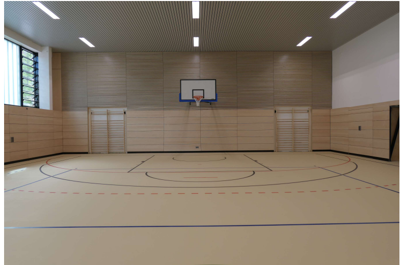
Halle nach der Sanierung

Die Haustechnik wurde insgesamt erneuert, die Halle hat eine Niedertemperatur-Deckenheizung erhalten, Energieträger ist Fernheizung. Eine Heizungssteuerung (MSR) wurde ebenfalls neu eingebaut.