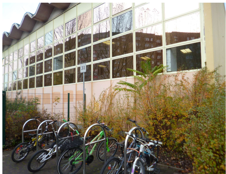
Halle vor der Sanierung