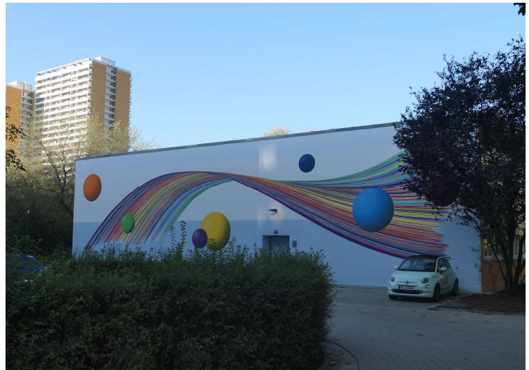
Ost-Ansicht mit Kunst am Bau