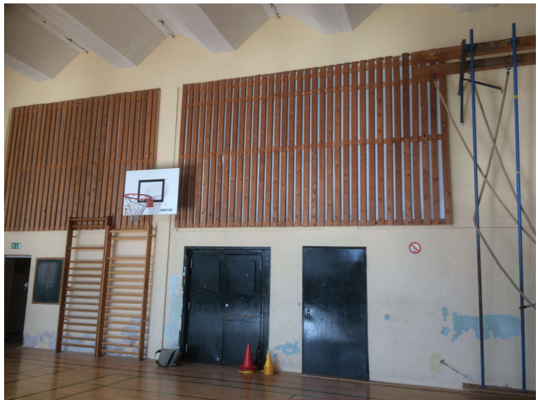
Halle vor der Sanierung