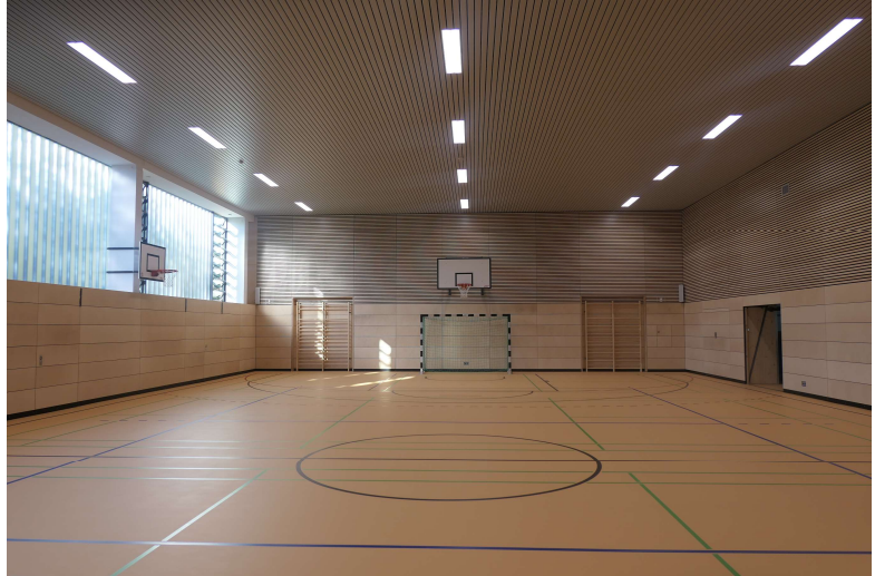
Halle nach der Sanierung

Der Umkleidebereich wurde grundlegend umgebaut, statt bisher 2 Umkleiden wurden 4 Umkleidebereiche erstellt, mit 2 zugeordneten Duschbereichen, dadurch lassen sich die Klassenwechsel im Sportunterricht wesentlich besser organisieren. Die Haustechnik wurde insgesamt erneuert, die Halle hat eine Niedertemperatur-Deckenheizung erhalten, Energieträger ist Fernheizung. Eine Heizungssteuerung (MSR) wurde ebenfalls neu eingebaut.