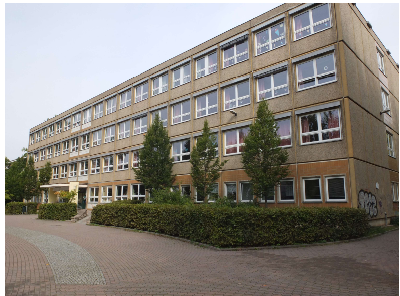
Ansicht vor der Sanierung